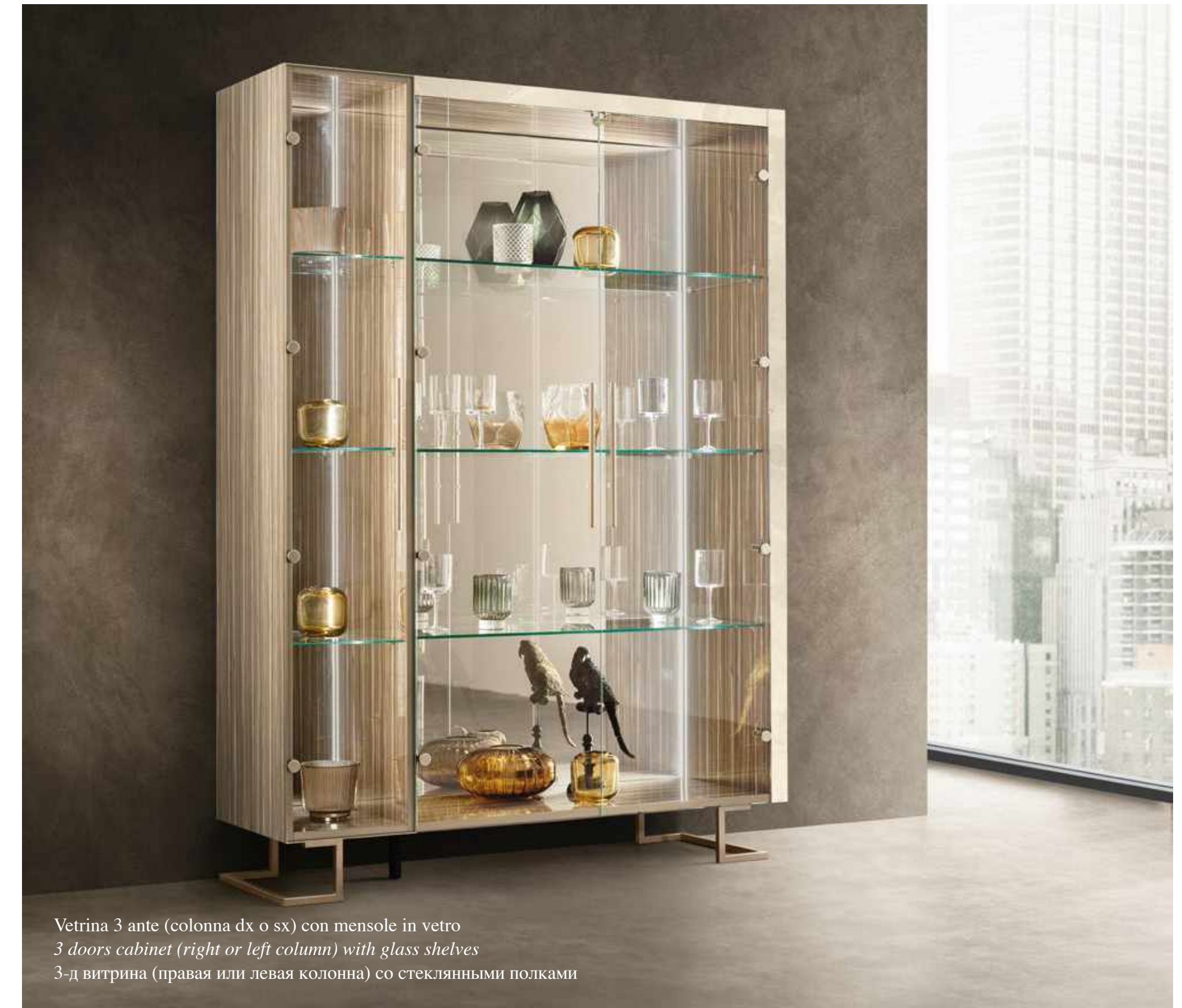
Vetrina 3 ante (colonna dx o sx) con mensole in vetro 3 doors cabinet (right or left column) with glass shelves 3-д витрина (правая или левая колонна) со стеклянными полками

Элегантность, игра света и модульный дизайн горки для гостиной, которая может быть «сконструирована» в соответствии с пожеланиями заказчика, с добавлением одностворчатого модуля справа и/или слева от центрального двустворчатого элемента.