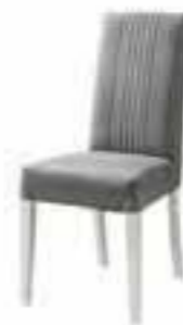
Upholstered chair L 46 W 58 H 99