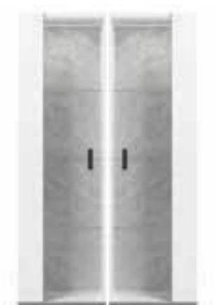
1/d vitrine L 56 W 45 H 188