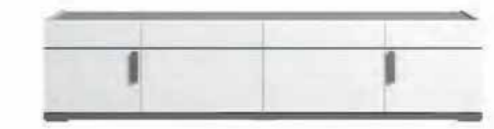
4/d tv unit L 195 W 50 H 45