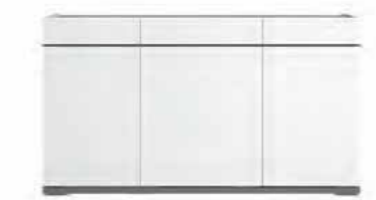
3/d buffet L 140 W 50 H 79