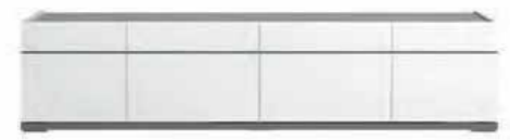
4/d tv unit L 195 W 50 H 45