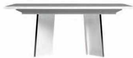
Table 180 + 1 extension L 180 (+45) W 104 H 76