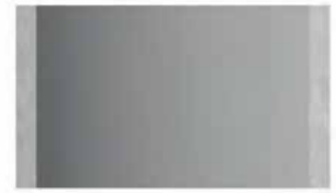
mirror L 138 W 2 H 80