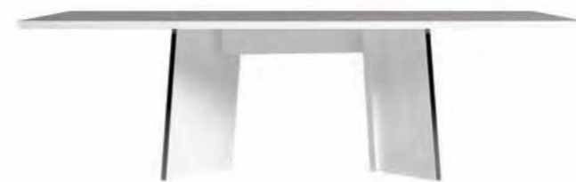
Fixed dining table 250 L 250 W 115 H 76

StatuS srl si riserva la facoltà di apportare modifiche ai prodotti senza obbligo di preavviso. Tutte le caratteristiche e i dati tecnici dei prodotti contenuti in questo catalogo hanno carattere puramente informativo quindi non impegnativo ai fini contrattuali.