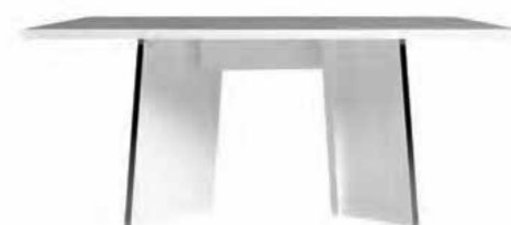
Fixed dining table 180 L 180 W 104 H 76