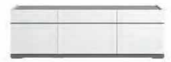
3/d tv unit L 140 W 50 H 45