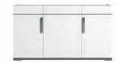
3/d buffet L 140 W 50 H 79