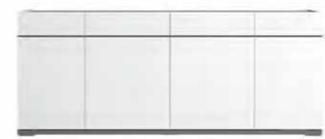
4/d buffet L 195 W 50 H 79