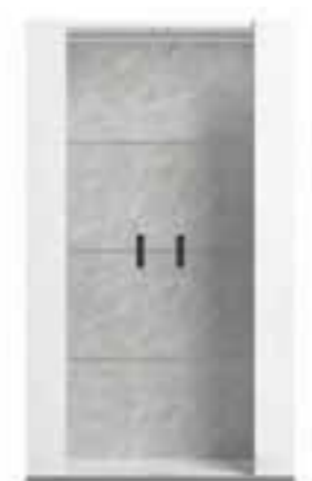
2/d vitrine L 108 W 45 H 188