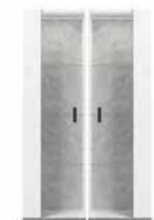
1/d vitrine L 56 W 45 H 188