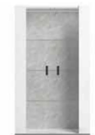
2/d vitrine L 108 W 45 H 188