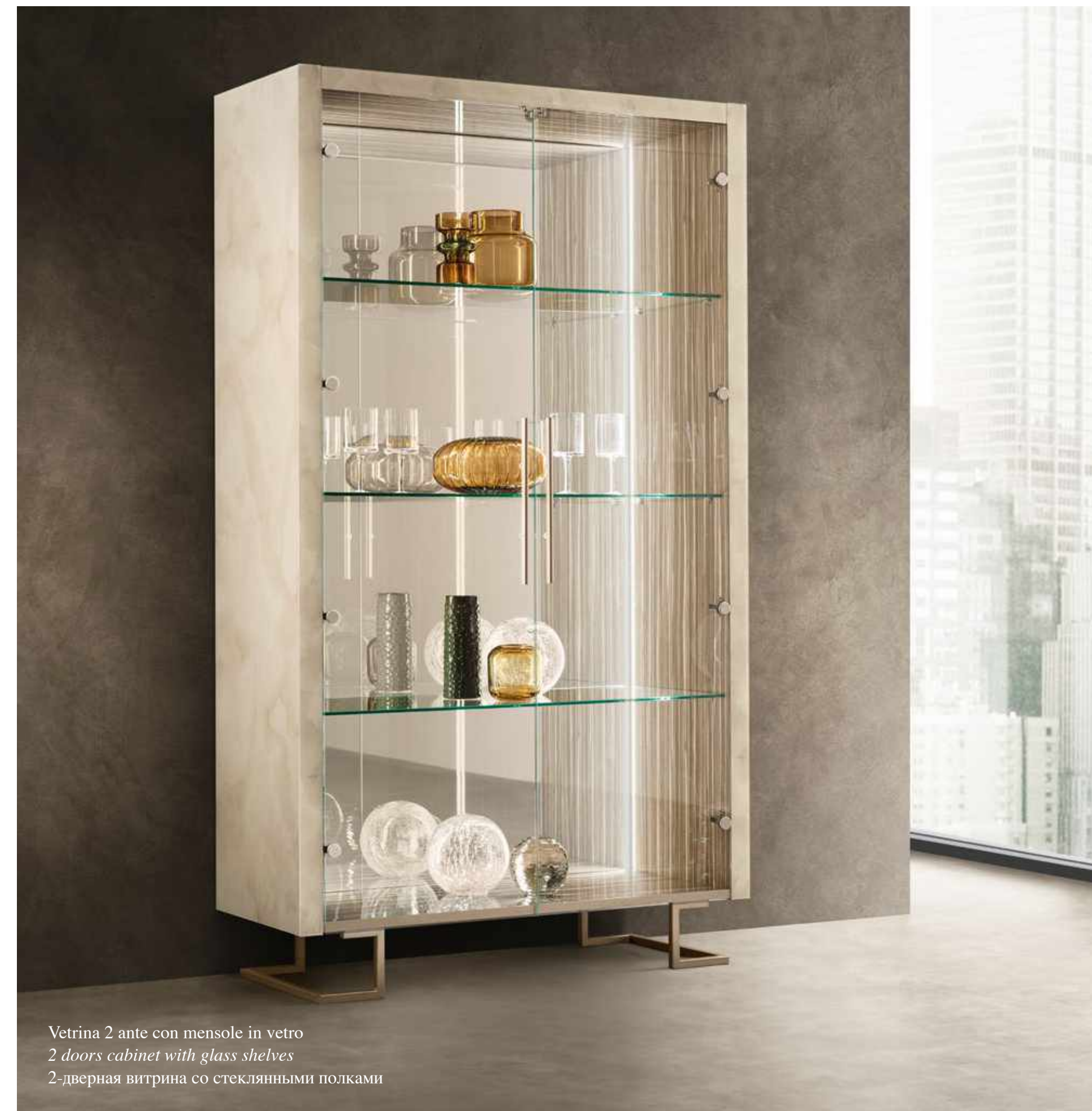
Vetrina 2 ante con mensole in vetro 2 doors cabinet with glass shelves 2-дверная витрина со стеклянными полками