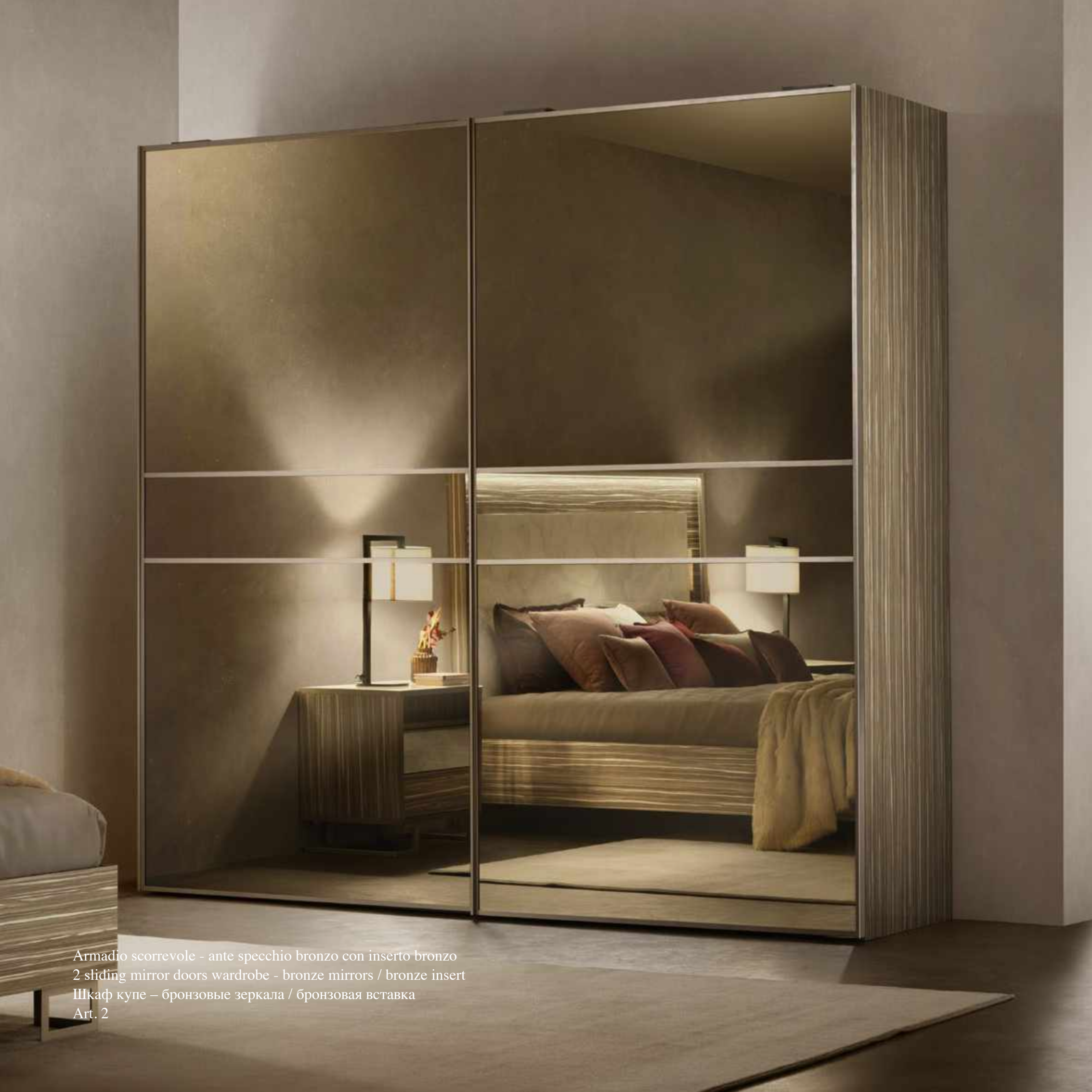
Armadio scorrevole - ante specchio bronzo con inserto bronzo 2 sliding mirror doors wardrobe - bronze mirrors / bronze insert Шкаф купе – бронзовые зеркала / бронзовая вставка Art. 2