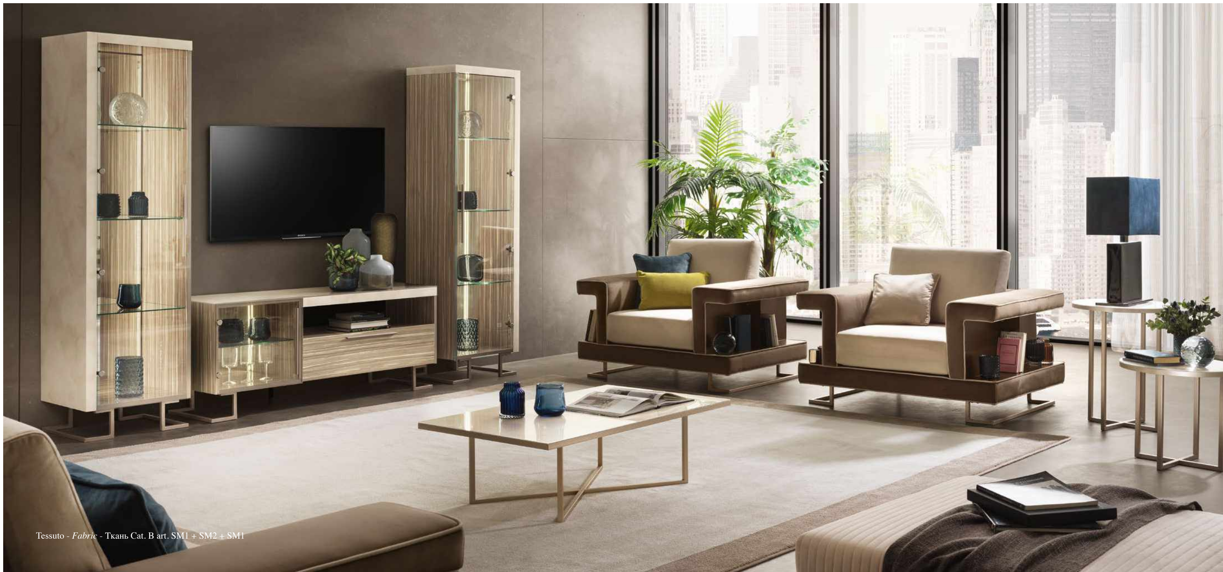
Tessuto - Fabric - Ткань Cat. B art. SM1 + SM2 + SM1