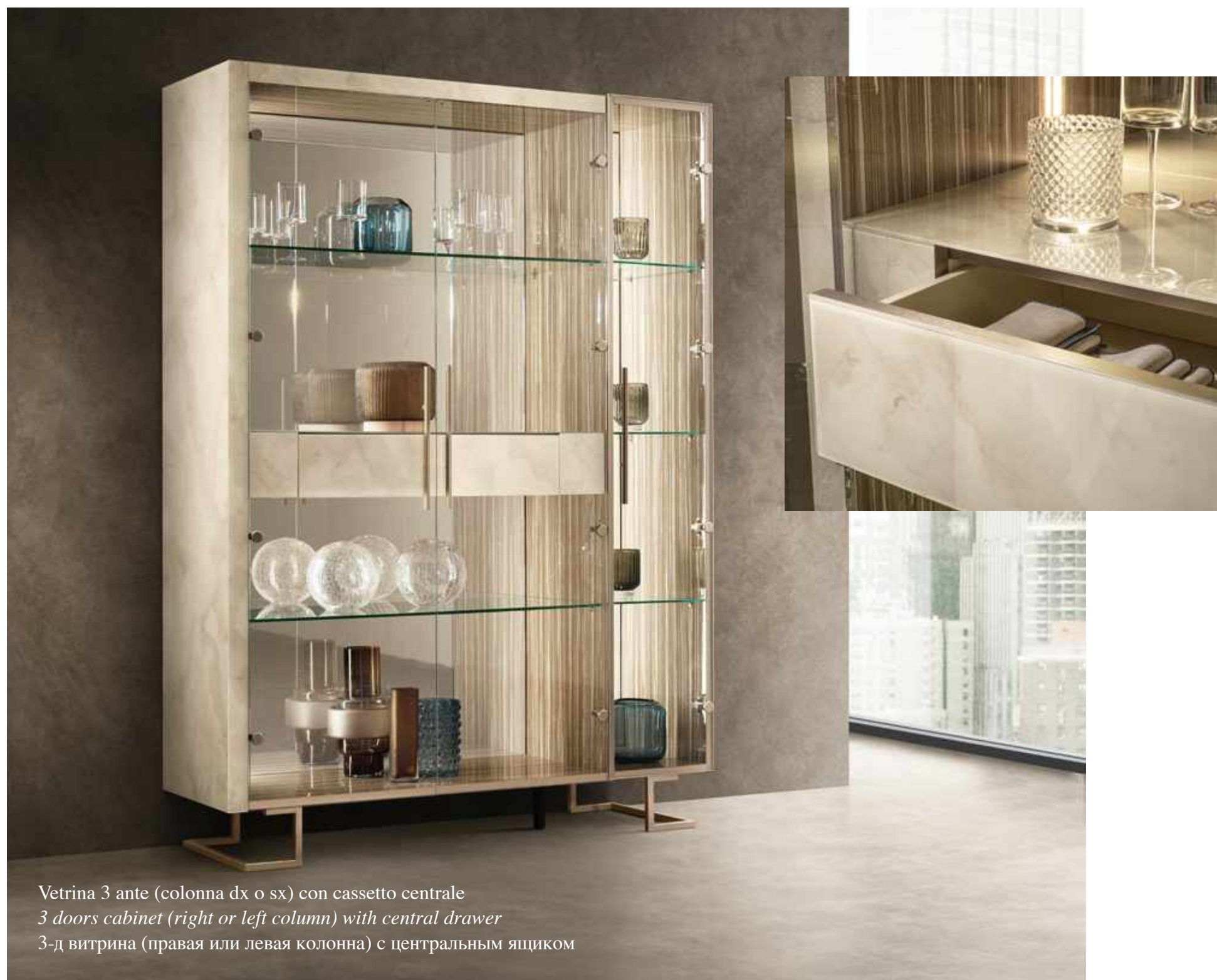
Vetrina 3 ante (colonna dx o sx) con cassetto centrale 3 doors cabinet (right or left column) with central drawer 3-д витрина (правая или левая колонна) с центральным ящиком

Еще одним элементом, позволяющим компоновать и персонализировать состав горки, является выдвижной ящик, который может устанавливаться в центральный двухдверчатый модуль, для увеличения его универсальности и вместимости. Внутренний объем ящика обтянут бархатом, а отделка наружной части из светлого оникса перекликается с аналогичным эффектом столешниц и боковин.