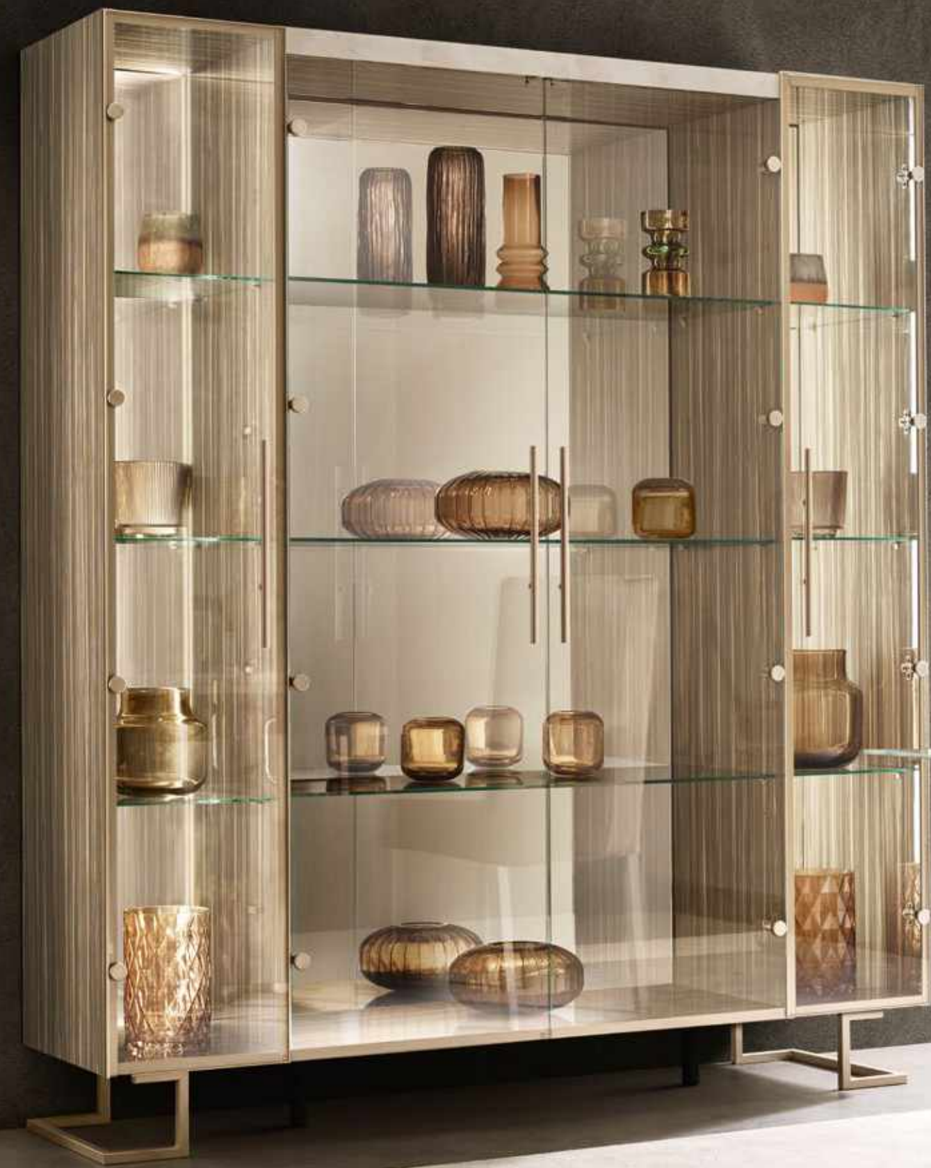
Vetrina 4 ante con mensole in vetro 4 doors cabinet with glass shelves 4-дверная витрина со стеклянными полками

Eleganza, giochi di luce e design modulare per la vetrina della zona giorno, che può essere "costruita" su misura delle esigenze del cliente, inserendo a destra e/o a sinistra dell'elemento centrale a due ante un modulo aggiuntivo ad anta singola.