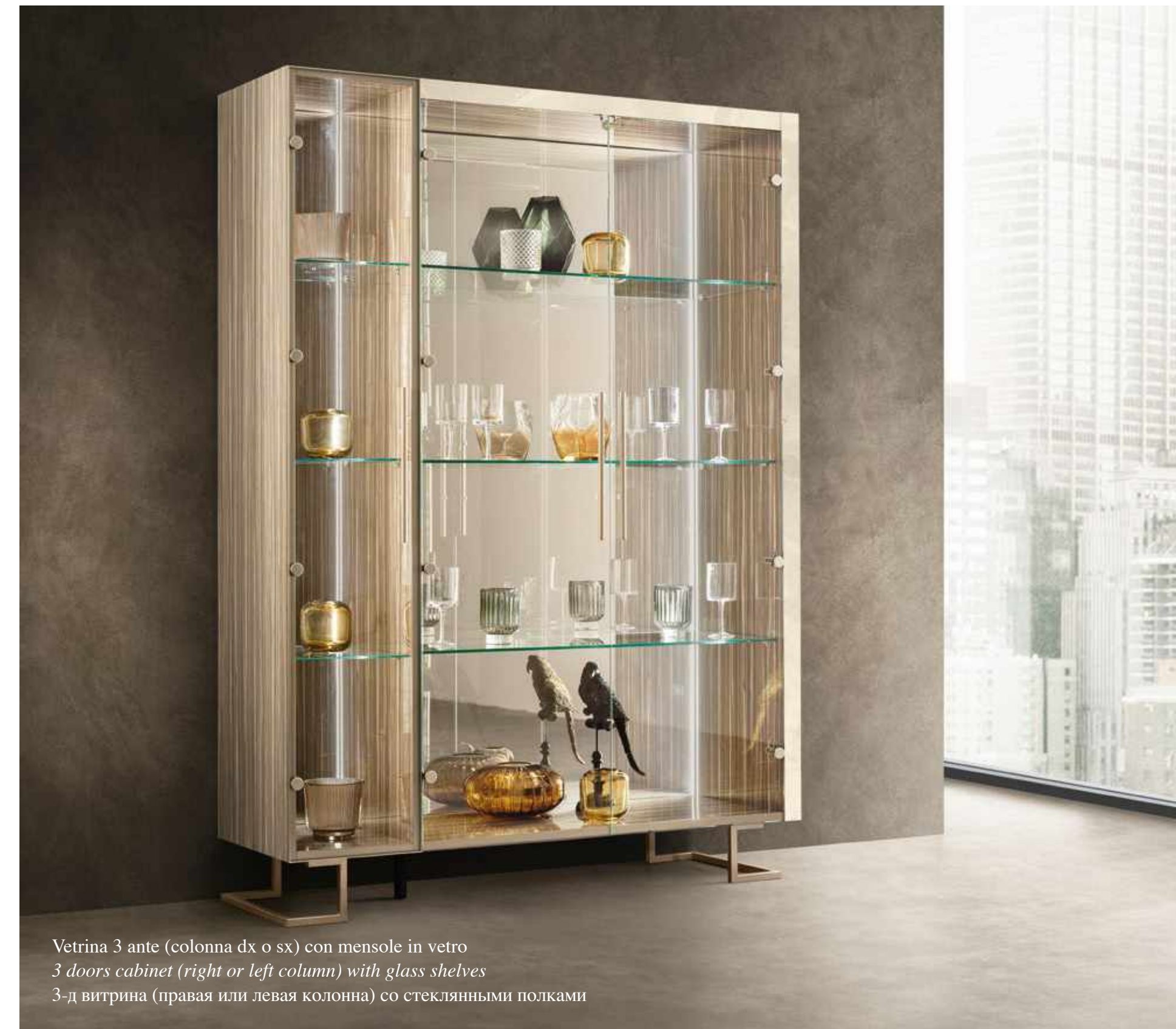
Vetrina 3 ante (colonna dx o sx) con mensole in vetro 3 doors cabinet (right or left column) with glass shelves 3-д витрина (правая или левая колонна) со стеклянными полками