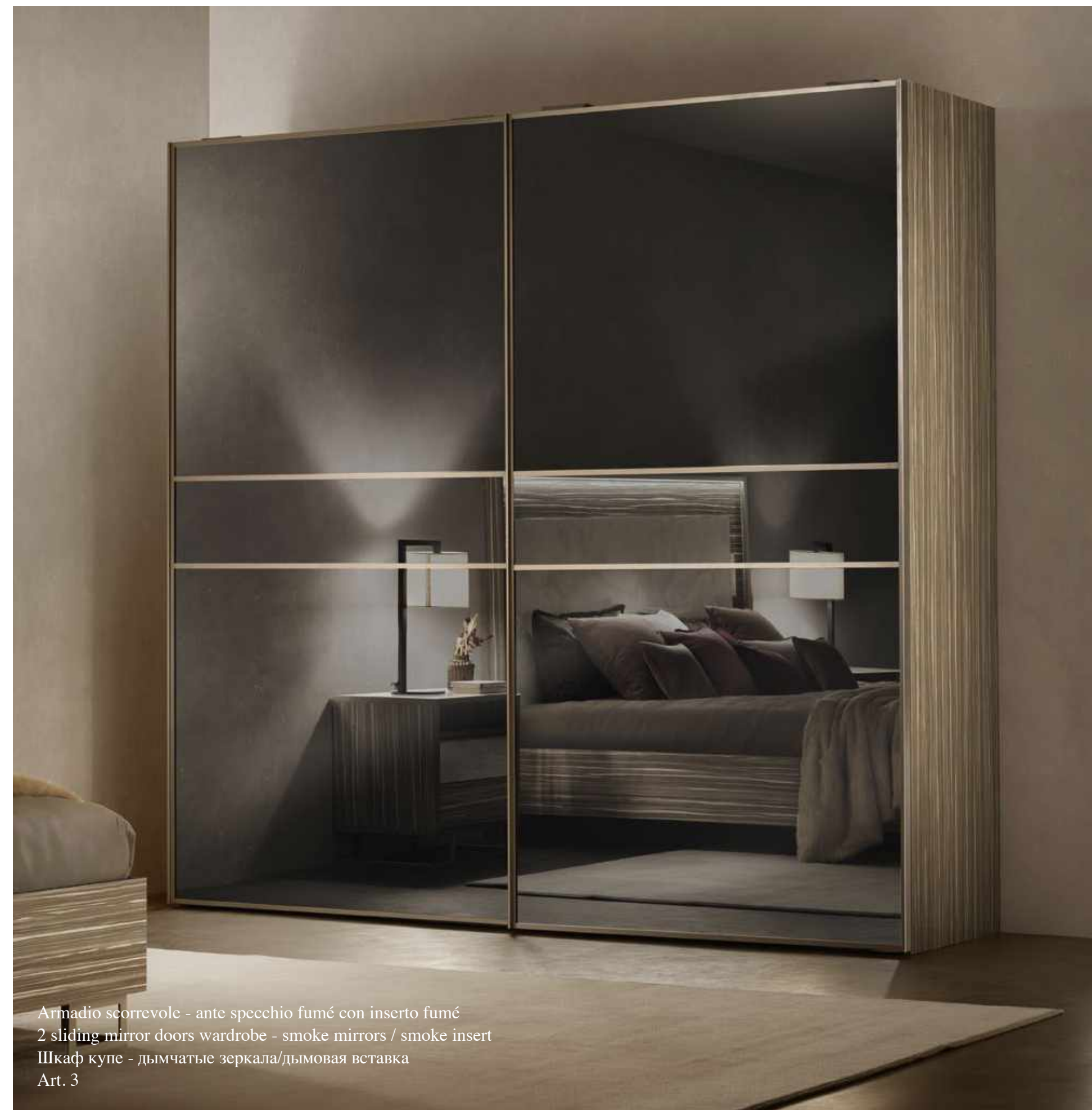
Armadio scorrevole - ante specchio fumé con inserto fumé 2 sliding mirror doors wardrobe - smoke mirrors / smoke insert Шкаф купе - дымчатые зеркала/дымовая вставка Art. 3