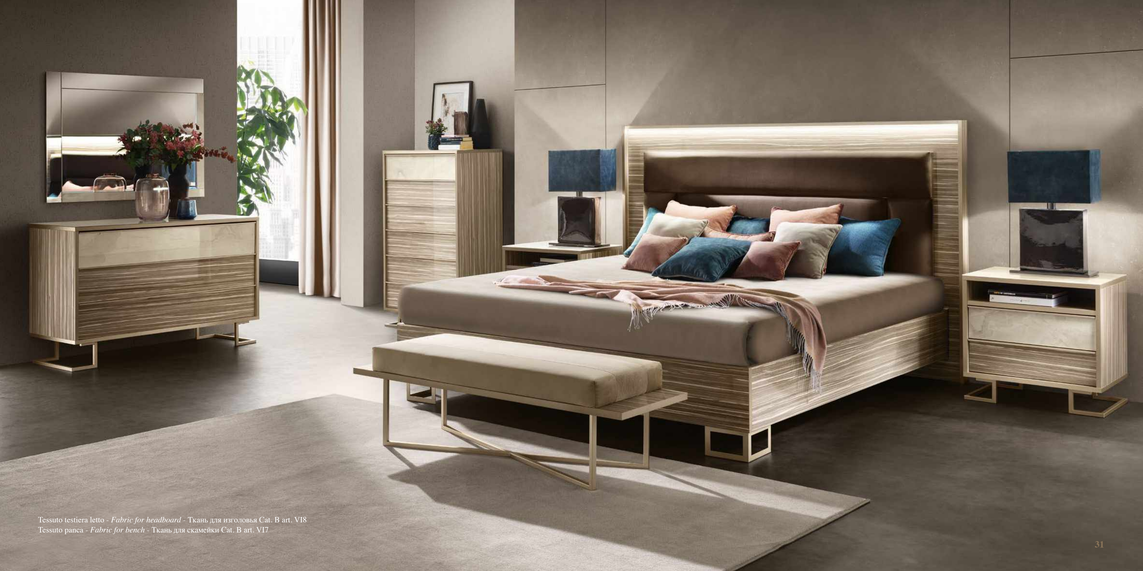
Tessuto testiera letto - Fabric for headboard - Ткань для изголовья Cat. В art. VI8 Tessuto panca - Fabric for bench - Ткань для скамейки Cat. В art. VI7