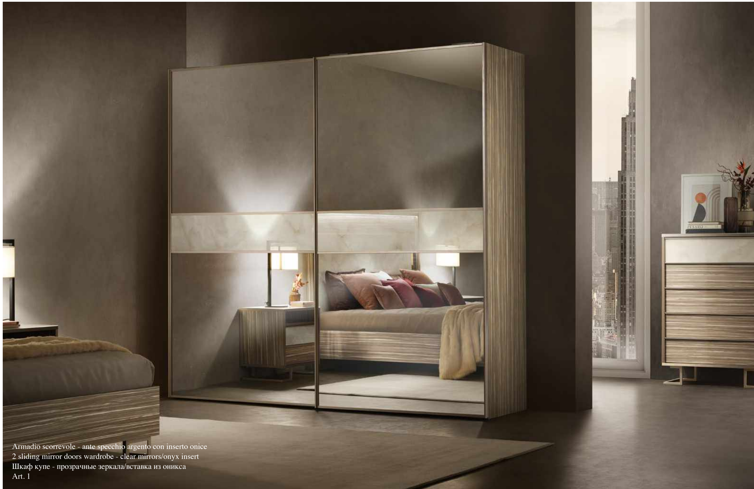
Armadio scorrevole - ante specchio argento con inserto onice 2 sliding mirror doors wardrobe - clear mirrors/onyx insert Шкаф купе - прозрачные зеркала/вставка из оникса Art. 1