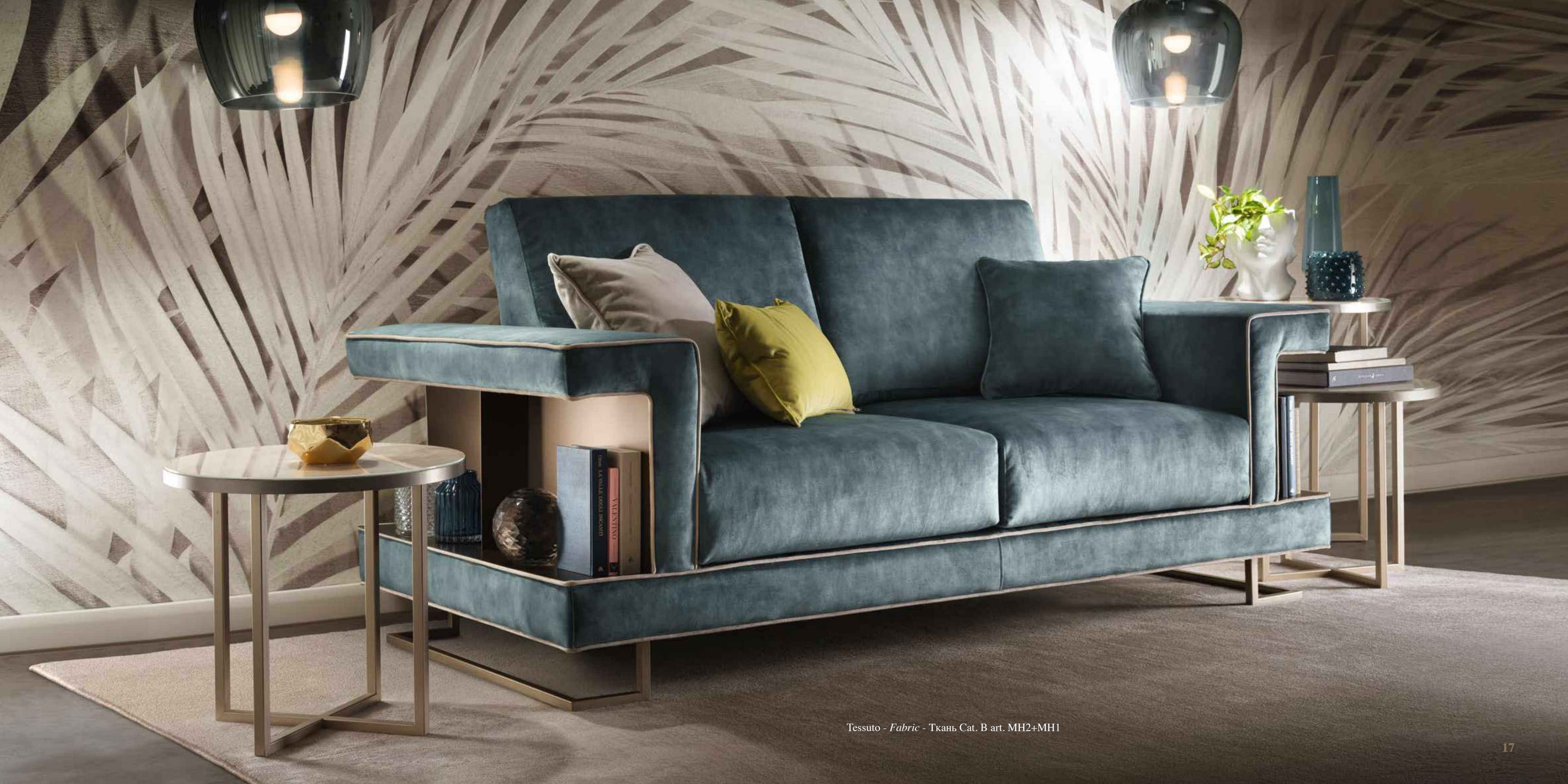
Tessuto - Fabric - Ткань Cat. B art. MH2+MH1