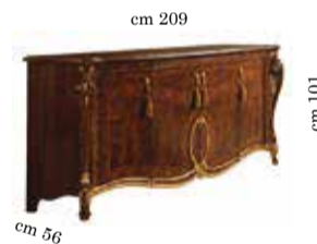
4/doors buffet Contromobile 4/ante Buffet 4/portes