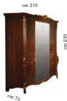
4/doors wardrobe h. 230 Armadio 4/ante h. 230 Armoire 4/portes h. 230