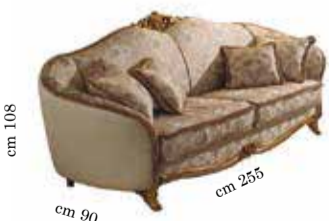
3/seat sofa Divano 3/posti Canapé 3/places