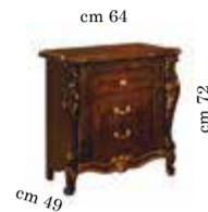
Night table Comodino Chevet