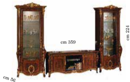
COMPOSITION N° 15 TV set composition Composizione vetrine/TV Composition meuble télé