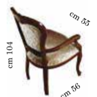
Armchair art. 150 Sedia c/braccioli art. 150 Chaise à bras art. 150