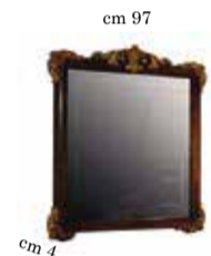
Mirror for 2/doors buffet Specchiera per contr. 2/ante Miroir pour buffet 2/portes