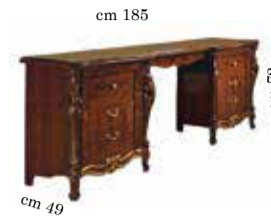
Dressing table Toilette Coiffeuse