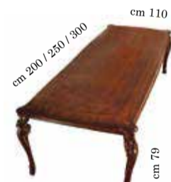
Rect. table with 2/extension cm. 110x200 / 250 / 300 Tavolo rettangolare con 2 allunghi Table rectangulaire avec n. 2/rallonges