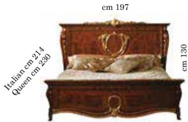
Bed art. 150 Queen or Italian size Letto art. 150 160x190/200 Lit art. 150 pour literie 160x190/200