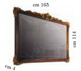
Large mirror for dressing table Specchiera grande per toilette Grande miroir pour coiffeuse