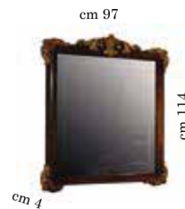
Mirror for 4/Dr. dresser (and dressing table) Specchiera piccola per comò 4/cass. o toilette Miroir pour commode 4/t. et coiffeuse