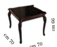
End/lamp table Tavolo quadrato salotto Table de coin