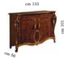
2/doors buffet Contromobile 2/ante Buffet 2/portes