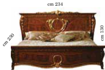
Bed art. 150 King size Letto art. 150 King 180/200x200 Lit art. 150 King pour literie 180/200x200