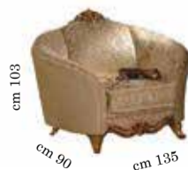
Armchair Poltrona Fauteuil