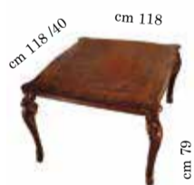
Square 1/extension table cm 118x118+40 Tavolo quadrato allungabile Table carré allongeable