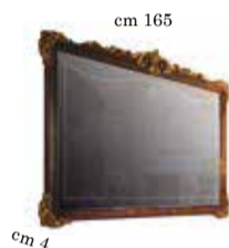
Mirror for 4/doors buffet Specchiera per contr. 4/ante Miroir pour buffet 4/portes