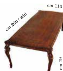
Rect. table with 1/extension cm 110x200 / 250 Tavolo rett. con 1 allungo Table rectangulaire avec n.1/rallonge