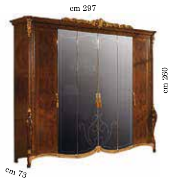
6/doors wardrobe h. 260 Armadio 6/ante h. 260 Armoire 6/portes h. 260