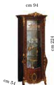
1/door cabinet Vetrina 1/anta Vitrine 1/porte