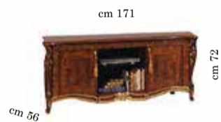
TV cabinet Art. 150 Mobile porta TV Art. 150 Meuble télé Art. 150