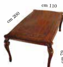
Rectangular fixed top table Tavolo rettangolare fisso Table rectangulaire fixé