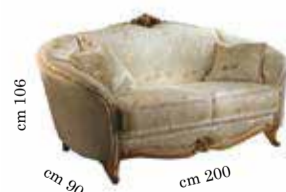
2/seat sofa Divano 2/posti Canapé 2/places