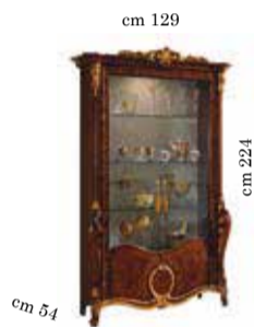
2/doors cabinet Vetrina 2/ante Vitrine 2/portes