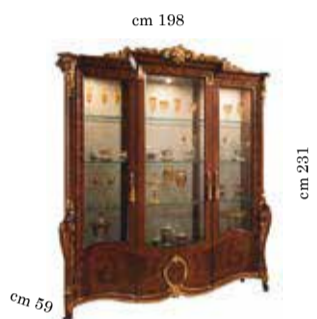
3/doors cabinet Vetrina 3/ante Vitrine 3/portes