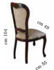
Chair art. 150 Sedia art. 150 Chaise art. 150