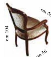
Armchair art. 150 Sedia c/braccioli art. 150 Chaise à bras art. 150