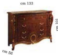
4/drawers dresser Comò 4/cassetti Commode 4/tiroirs